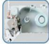
(圖3) 豎打標籤機構圖