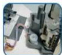
(圖1) 快速更換打印機構