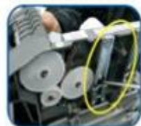
(圖2) 拉軌可快速拉出